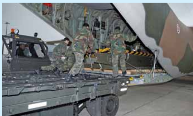
C-130 transporta ponte durante o auxílio à Madeira