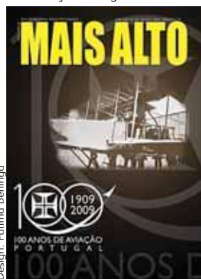
Design: Fátima Berlinga

CAPA: Armand Zipfel, em 17 de Outubro de 1909 no Hipódromo de Belém. Imagem de Joshua Benoliel para a “Ilustração Portuguesa”