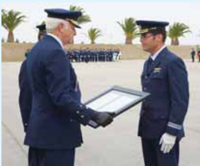
Entrega do Louvor ao Centro de Actividades Aéreas