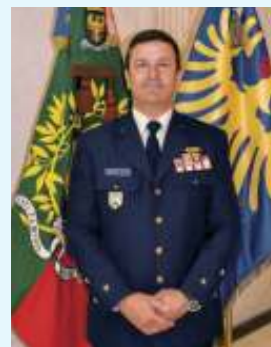
TGen Cartaxo Alves