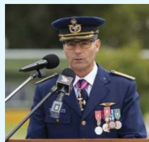
Cor Luís Seródio

Os momentos mais significativos deste acontecimento foram a Apresentação e Revista às Forças, a Integração da Bandeira Nacional e a alocução do Comandante da Unidade, Coronel Luís Nunes Seródio. Terminada a sempre esperada intervenção do Comandante, a cerimónia prosseguiu com a Rendição do Porta-Bandeira Nacional e do Porta-Estandarte da Unidade, a imposição de condecorações a militares da BA1 e o Desfile das Forças em Parada que encerrou o evento.