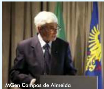
MGen Campos de Almeida