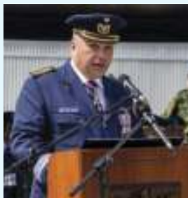
Cor Bispo dos Santos

Do acontecimento, que decorreu na Ota e foi presenciado por altas individualidades militares e civis, destacam-se como elementos dignos de registo para memória futura, a Revista às Forças; a integração da Bandeira Nacional; a alocução do Comandante da Unidade, Coronel Armando Bispo dos Santos; a Rendição do Porta-Bandeira e do Porta-Estandarte da Unidade; a imposição de condecorações a militares do CFMTFA; e o Desfile das Forças em Parada, que deu por concluído o evento.