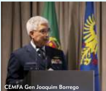
CEMFA Gen Joaquim Borrego