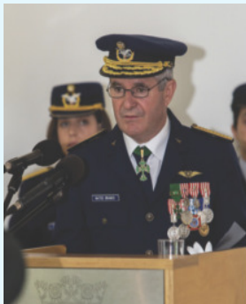
MGen Matos Branco

No dia 10 de abril decorreu a cerimónia comemorativa do 62.º aniversário do Comando Aéreo, em Monsanto. Do evento, presidido pelo Chefe do Estado-Maior da Força Aérea, General Joaquim Nunes Borrego, e que contou com a presença de altas entidades civis e militares, destacam-se a alocução do Comandante Aéreo em suplência, Major-General António de Matos Branco, a Rendição do Porta-Bandeira Nacional e do Porta-Estandarte da Unidade e a imposição de condecorações a militares do Comando Aéreo.