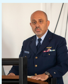
BGen Paulo Neves

Decorreu, no dia 26 de setembro, a Cerimónia Comemorativa do Dia dos Órgãos de Saúde da Força Aérea, presidida pelo Chefe do Estado-Maior da Força Aérea e que contou