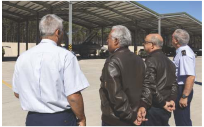
Linha da Frente