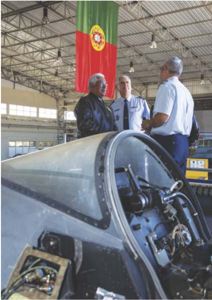
Hangar da Manutenção