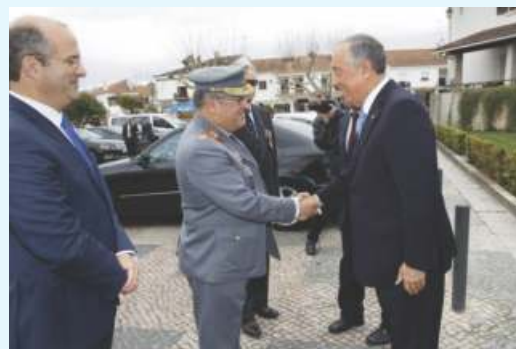
General Pina Monteiro