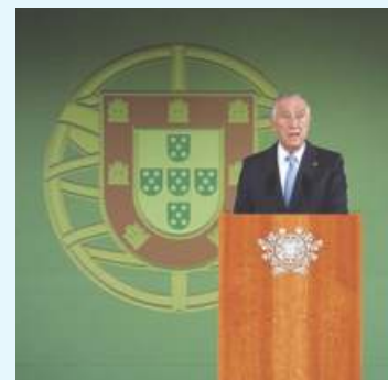
Professor Doutor Marcelo Rebelo de Sousa