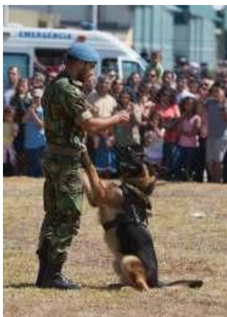
SERRA DO CARVALHO