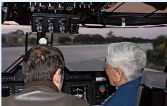
BA6, na cabina do EH-101