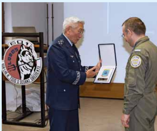
BA11, na Esquadra 601