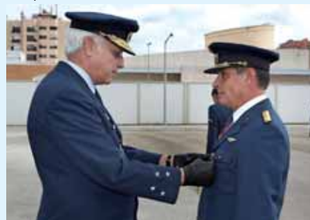
Protecção Civil na Base Aérea de Sintra